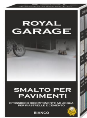
Confezione da 750 ml.