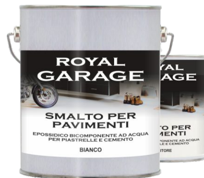
Latta da 2,5 Lt.